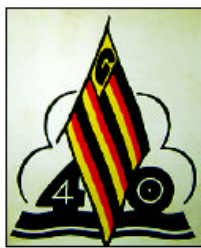
Emblém čtyřicetiletého výročí ke vzniku klubu v roce 1925 (vlevo).