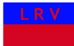
Obr. 15 Lundenburger Ruderverein