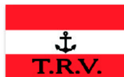
Obr. 9 Troppauer Ruderverein