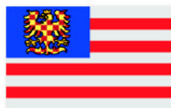
Obr. 4 Brünner Ruderverein