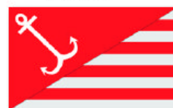
Obr. 14 Český klub veslařský i bruslařský v Haze