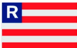
Obr. 7 Ruderverein „Jegutta“