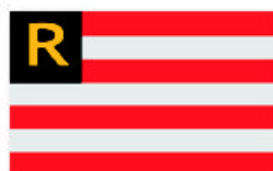
Obr. 6 Vereinigter Eis-Club und Ruderverein „Jegutta“ zu Prag