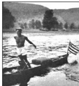
Použití vlajky pražské Regatty v roce 1881, ve 30. letech 20. století a v r. 1925.