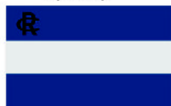
Obr. 8 Tetschner Ruderverein „Carolus“