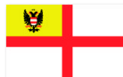
Obr. 10 Ruderverein „Brunz“ (in Brün)