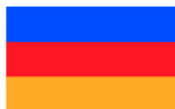
Obr. 2 Veslářská jednota v Hradčích / Ruderverein „Moravia“ in Hradčich