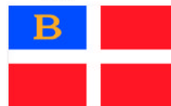
Obr. 16 Klub veslařů v Brančově nad Labem