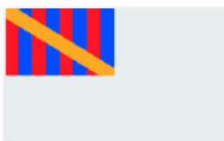
Obr. 3 Veslářská jednota v Uh. Hradčích / Ruderverein „Moravia“ in Uh. Hradčich